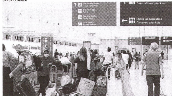
DENTRE AS MEDIDAS no Aeroporto de Fortaleza estão a aferição térmica

A Fraport acrescenta que o álcool em gel foi colocado à disposição dos passageiros em locais de grande circulação. Além disso, a Secretaria da Saúde do Estado do Ceará (Sesa) continua realizando a aferição de temperatura dos passageiros na área de restituição de bagagens, após o desembarque.