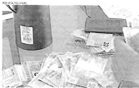
OPERAÇÃO foi desenhada pela PF em quatro estados; dinheiro foi apreendido

O início da investigação teria sido a partir do monitoramento de um traficante de drogas cearense, que atuava no região do Ceará, conhecido como "Beto da Milha". No decorrer do trabalho policial, o investigador foi executado na cidade de Brejo Verde, em abril de 2023, em frente a uma residência, a que se tratava de um estabelecimento comercial. Após a execução do trabalho, foi identificado que o controle das atividades criminosas havia sido transferido para novos indivíduos, que se tratavam os alunos do oásio. Na manhã de terça-feira,