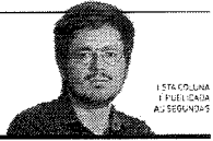
ESTRUTURA FUNDADA EM 1982