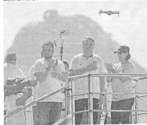
BOLSONARO e Michelle em ato no Rio de Janeiro

O ato em defesa do ex-presidente Jair Bolsonaro (PL) no Rio de Janeiro, neste domingo, 21, foi marcado por acusações de parcialidade contra o ministro Alexandre de Moraes, do Supremo Tribunal Federal (STF), críticas ao governo do presidente Luiz Inácio Lula da Silva (PT) e ao presidente do Congresso, Rodrigo Pacheco (PSD-MG) e por manifestações de gratidão ao empresário Elon Musk, dono do X, da Tesla, da SpaceX e da rede de satélites Starlink.