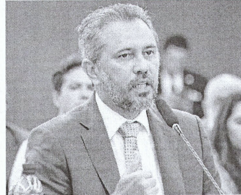
ELMANO articulou subsídio com a construção civil

O governador Elmano de Freitas (PT) enviou na noite de segunda-feira, 15, à Assembleia Legislativa mensagem que cria o programa Entrada Moradia Ceará, que irá ampliar em até R$ 50 mil o subsídio concedido a imóveis adquiridos pelo programa Minha Casa Minha Vida (MCMV) no Estado.