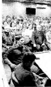
CURSO ocorre no Complexo de Comissões Temáticas

leia, foram aprimoradamente do nível requerimentos digitais protocolados na última legislatura. Se você pudesse imaginar que antes desse protocolo (online) era papel, seria perto de não mil folhas", exemplifica.