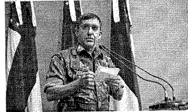
GENERAL Estevam Theophilo Gaspar de Oliveira