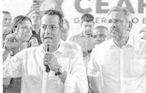
VITOR VALIM, prefeito de Caucaia, com o governador Elmano de Freitas

O cargo de prefeito de Caucaia, Região Metropolitana de Fortaleza (RMF), deve ser o último que ocupará Vitor Valim, atual gestor do município. Ele disse que não disputará eleições futuras ou exercerá cargos públicos. Ele confirmou ao OPOVO a intenção, que tenta ser evitada pelo governador Elmano de Freitas (PT).