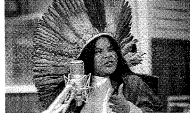
RECURSO VALEGAR INCONSTITUCIONALIDADE

A ministra dos Povos Indígenas, Sônia Guajajara, afirmou, ontem, 20, que o governo prepara recursos ao Supremo Tribunal Federal (STF) contra a tese do marco temporal das terras indígenas, aprovada pelo Congresso Nacional. Guajajara participou do programa Boa dia, Ministra, do Canal Gov, e fez um balanço da gestão neste ano.