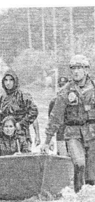
O FIM DE semana foi de muita chuva no RS

Segundo o balanço mais recente do governo estadual, até o momento 76.399 pessoas foram resgatadas depois de ficarem ilhadas em diferentes