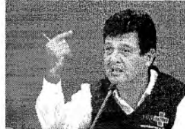
MINISTRO Mandetta: "Quem tem mandato fala e quem não tem trabalha", sobre o chefe Bolsonaro, que tem mandato

As palavras são muito reveladoras. Primeiro, de que o presidente não tem autoridade sobre o ministro. O presidente é o chefe e deve se fazer ouvir. Não é necessário do ministro. Segundo, quem deve conduzir o País não é o ministro, é o presidente. Ou deveria ser assim. Terceiro, chefe não dá liberdade em subordinado em público. Ou determina que ele faça diferente ou troca. Se não tem como fazer nem uma coisa nem outra, fica quieto. As declarações do presidente demonstram fraqueza.