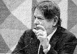
SENADOR Cid Gomes (PDT)