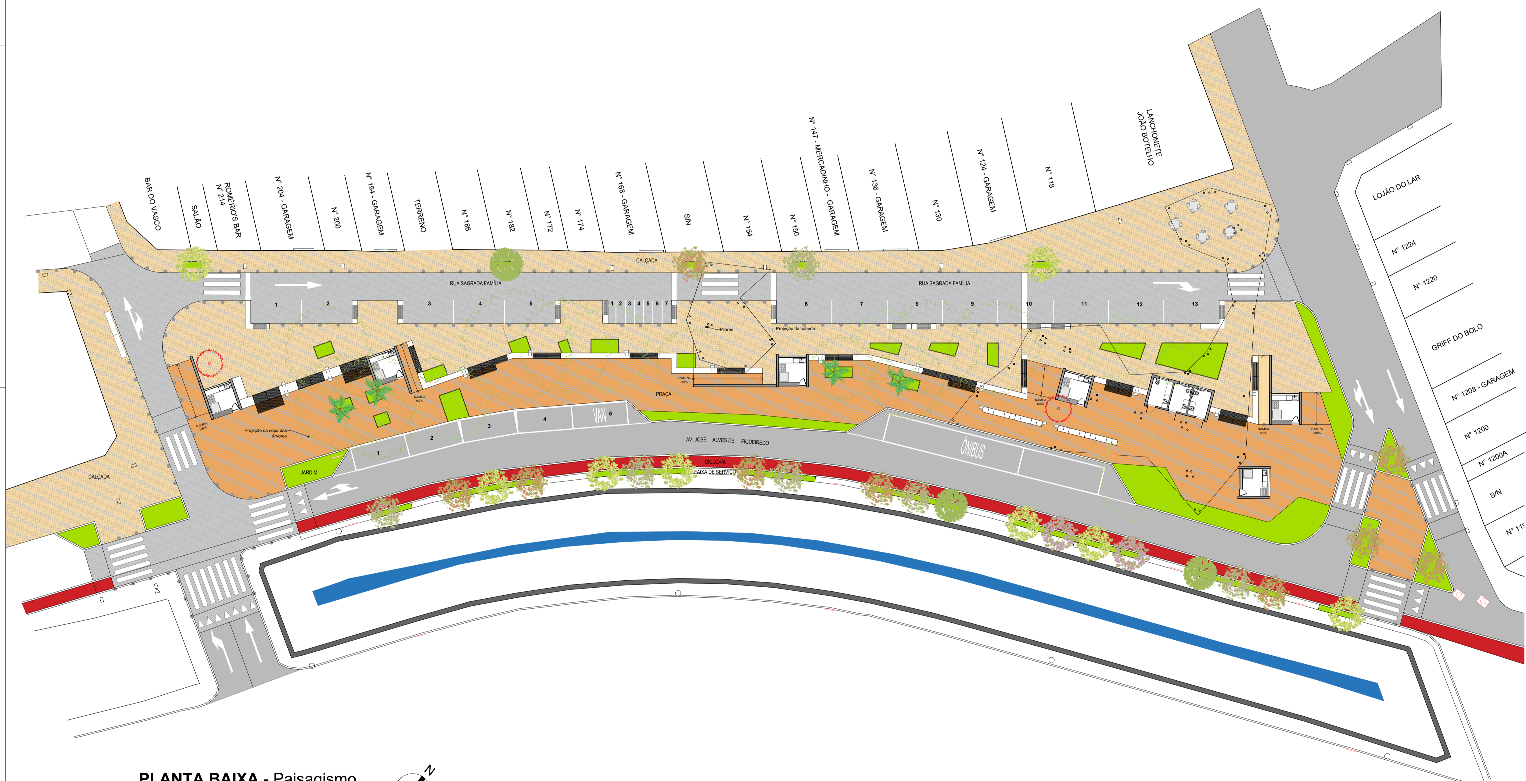
PLANTA BAIXA - Paisagismo ESCALA: 1/250