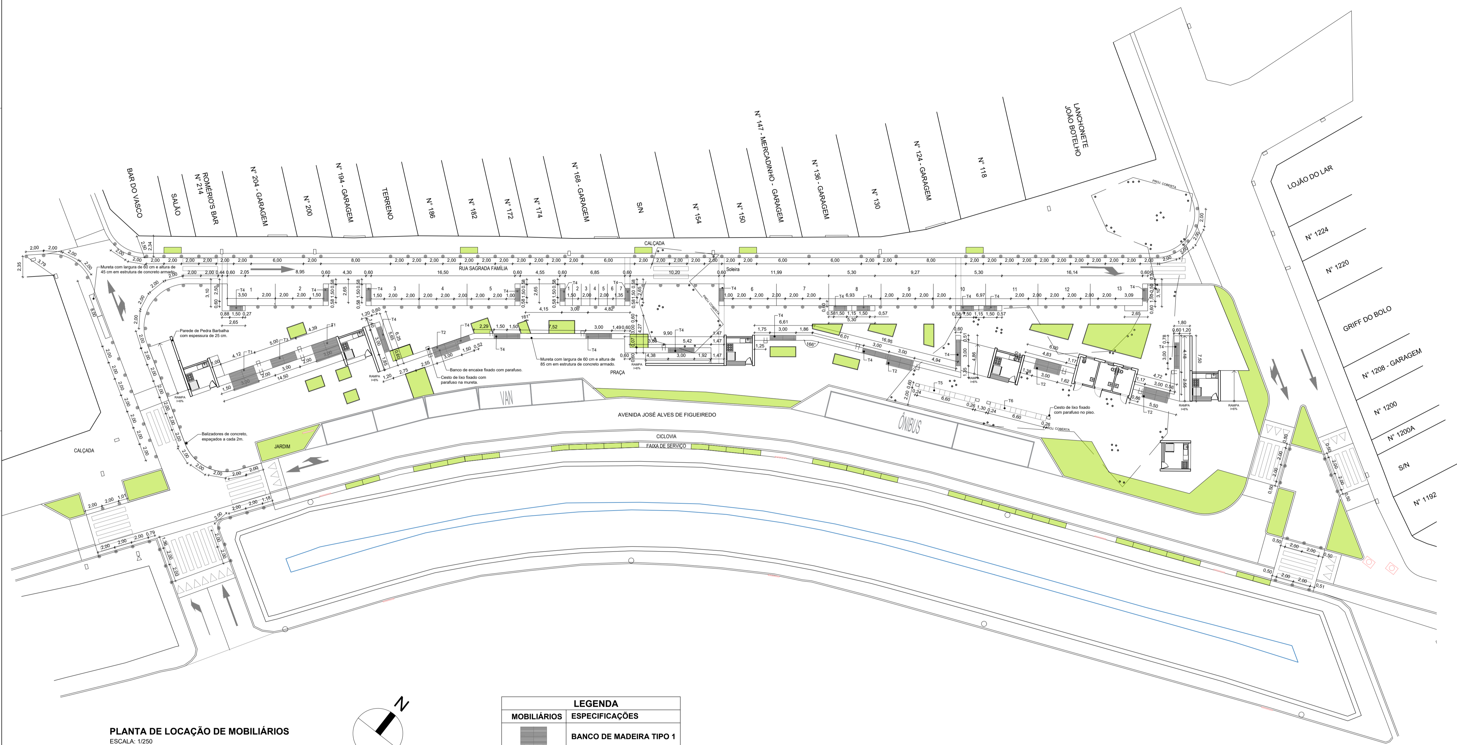
PLANTA DE LOCAÇÃO DE MOBILIÁRIOS ESCALA: 1/250