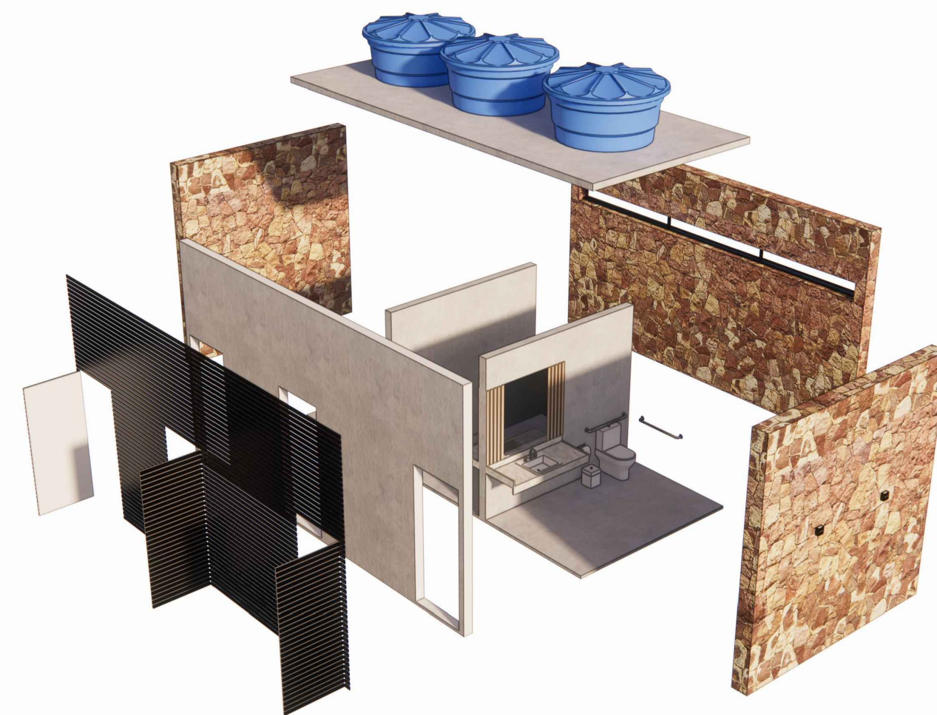
PERSPECTIVA ISOMÉTRICA - BANHEIROS ESCALA: 1/25