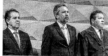
ELMANO participou ontem de evento no TRE-CE