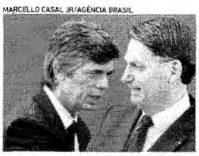
TEICH e Bolsonaro não parecem afinados sobre isolamento social

Mas senta aí que tem mais. Tem a outra crise do governo. Existe uma pandemia no planeta. O ministro da Saúde, Nelson Teich, participou de reunião com senadores e afirmou que o ministério nunca orientou o fim do distanciamento social.