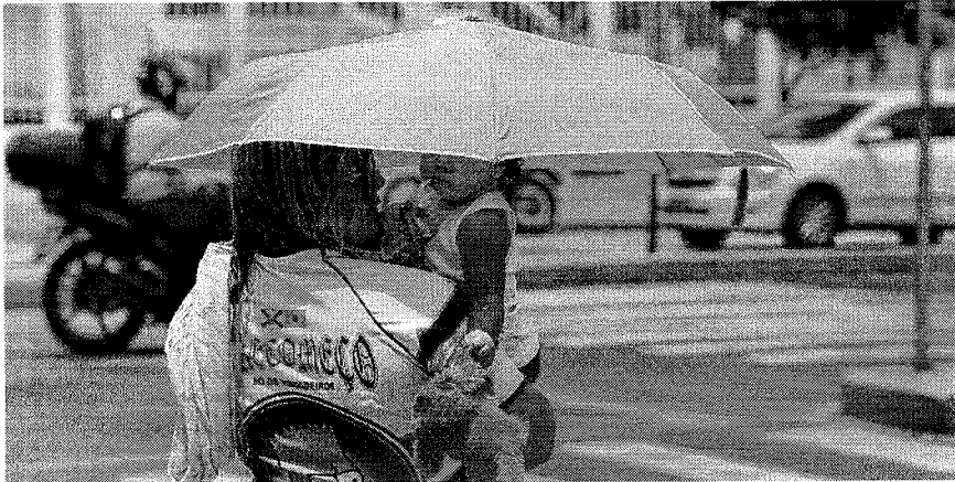
TEMPERATURA aumenta com a diminuição das chuvas neste fim de quadra chuvosa

ALEXIA VIEIRA alexia.vieira@opovo.com.br