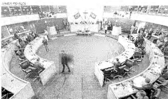
PLENÁRIO da ALECE

"Foi uma medida de cautela e de prudência em governador Elmano de instituir o fundo para poder garantir uma arrecadação que pudesse minimizar as perdas sofridas com a alteração do ICMS. Diante da aprovação do governo Lula de que era um gesto de reconhecimento dessas perdas, o governador teve segurança fiscal necessária para não implementar o fundo", declarou a deputada.