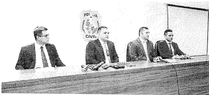
DELEGADOS falaram sobre a operação realizada em quatro cidades