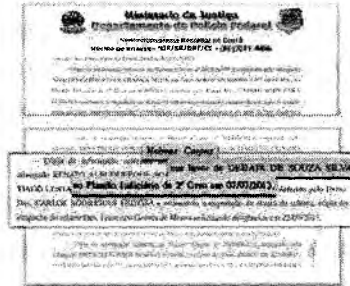
FAC-SÍMILE do processo do STJ, que investiga a suposta venda de habeas corpus.