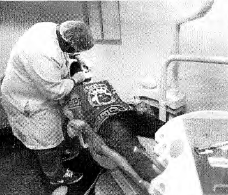
BRASIL concentra 20% dos dentistas do mundo

"Também as empresas estão cada vez mais preparadas para atender o cliente. Até porque, hoje, o Brasil tem 750 mil beneficiários dentistas, praticamente 50% no total no mundo, sendo que a gente tem 30% da população global. Então, temos uma odontologia de qualidade, com três das cinco melhores localidades do planeta na área", cita.