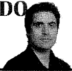
ESTA COLUNA É PUBLICADA AS QUARTAS