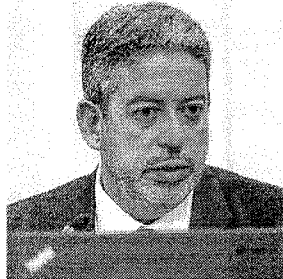
ARTHUR Lira, o dono da pauta

A regra do jogo mudou, mas Lira quer reaver a chave do cofre. No início do mês, comandou a derrubada dos decretos de Lula sobre saneamento. A manobra funcionou como um tiro de advertência. Se o governo não "confiar" e "delegar", arisca soltar novas derrotas.