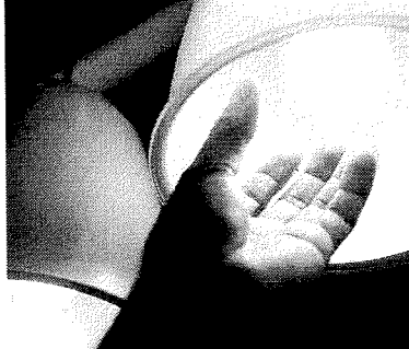
ELETRICIDADE no mercado regulado foi menos consumida em todo o País

De acordo com a CCEE, a queda de 1,7% no consumo de energia elétrica em 2022 foi puxada pelo pequeno consumidor, que respondeu por 86% da demanda energética e a redução de cerca de 3% no consumo desse perfil de usuário do Sistema Interligado Nacional (SIN) acabou puxando para baixo a média estadual, a despeito do aumento no consumo de 11 de 15 atividades econômicas monitoradas pela entidade.