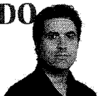
ESTA COLUNA É PUBLICADA AS QUARTAS