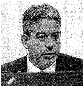
ARTHUR Lira, o dono da pauta

A regra do jogo mudou, mas Lira quer reaver a chave do cofre. No início do mês, comandou a derrubada dos decretos de Lula sobre saneamento. A manobra funcionou como um tiro de advertência. Se o governo não "confiar" e "delegar", arrisca sofrer novas derrotas.