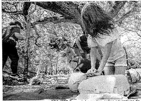
PROJETO Samuzinho realiza ações educativas de primeiros socorros voltadas para crianças

Cada um de nós tem como contribuir, mesmo com as nossas indiferenças sociais, quando tem alguém no chão todo mundo vai lá"