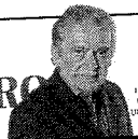
173 ANOS DE CRIANÇA E PUBLICADO EM 19 DE JULHO DE 2022