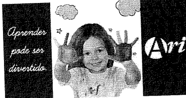
Aprender pode ser divertido.