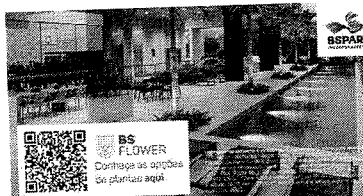
BS FLOWER Domingo as orquídeas de plantas aqui

PREDICAÇÃO É MUITO DIFÍCIL. ESPECIALMENTE SE É SOBRE O FUTURO. (Niels Bohr)