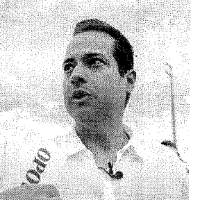
PREFEITO de Caucaia anunciou medida nessa quarta-feira