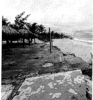
ESTRANGEIRO Peter Buchelt morava na Tabuba, no litoral oeste do Ceará

Um alemão de 75 anos foi encontrado morto dentro da própria residência na Praia da Tabuba, em Caucaia, ontem. A vítima foi identificada como Peter Buchelt. O POVO apurou que o corpo foi achado em dos quartos da casa, sujo de sangue, despido, amordaçado e com as mãos e os tornozelos amarrados.