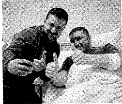
ZELENSKYY tira uma selfie com um homem ferido em um hospital em Kiev