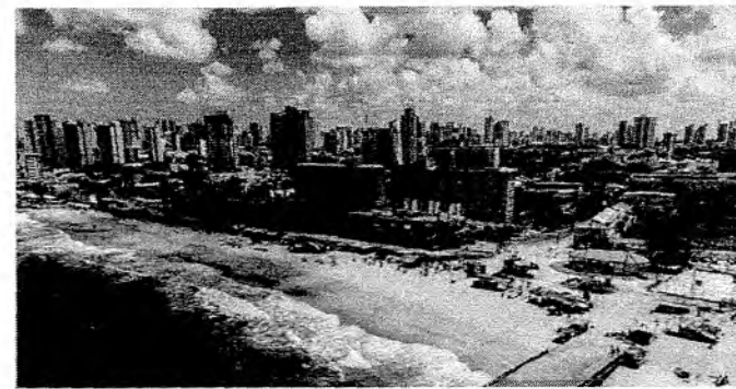
PRAIA DO Havaizinho receberá projeto de sustentabilidade

Melhor ideia terá prêmio de R$ 12 mil. Segundo e terceiro lugar receberão R$ 8 mil e R$ 5 mil, respectivamente