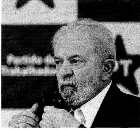
LULA em aparecido na liderança das pesquisas até o momento