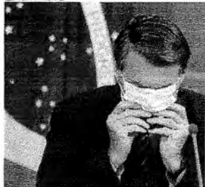
Presidente Jair Bolsonaro