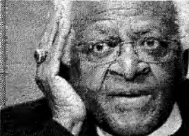
DESMOND Tutu morreu no último domingo aos 90 anos