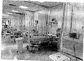
LEITOS hospitalares: pressão das doenças respiratórias