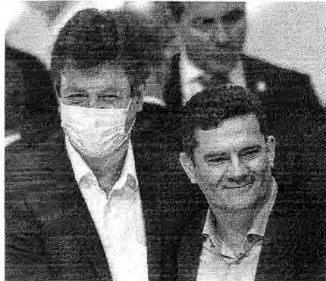
MANDETTA prestigiou Moro no ato de filiação dele ao Podemos há duas semanas

O deputado Luciano Bivar, futuro presidente nacional da União Brasil, indicou, ontem, a saída do ex-ministro da Saúde, Luiz Henrique Mandetta, da disputa presidencial do pelo futuro partido, resultante da fusão do PSI, com o DEM. O então pré-candidato, no entanto, negou sua desistência pela vaga do Planalto.