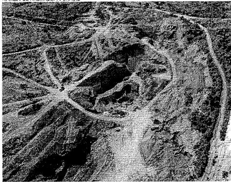
OPERAÇÃO Verde Brasil combateu em 2021 garimpo ilegal em terra indígena em Marabá