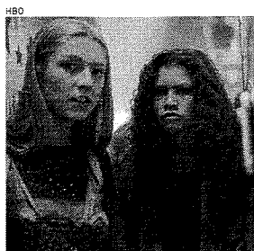
SEGUNDA temporada de 'Euphoria' terminou recentemente