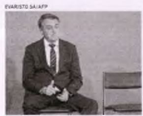
NA CONCEPÇÃO de Bolsonaro, democracia é algo que os militares podem escolher ter ou não

Quero retornar a um dos pontos citados acima: ditadura militar. Para defender o corporativismo militar entre as décadas de 1980 e 1990, Bolsonaro defendia abertamente o golpe de 1964. Fazia apologia de torturadores. Iusta conhecer um pouquinho da história do hoje deputado para saber que o apreço dele pela democracia é nenhum. Ele admira os golpistas de 1964 e os ditadores que se seguiram.