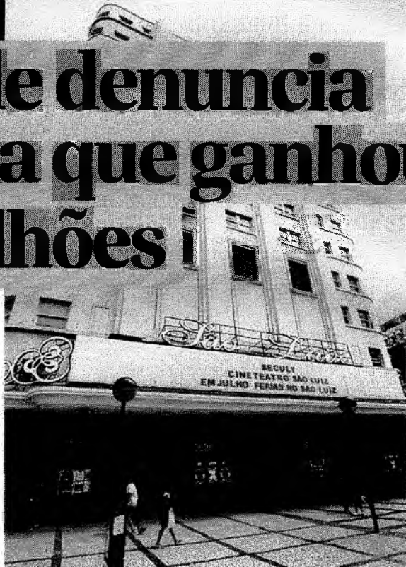
NO CENTRO DE FORTALEZA, a sede da Secult, para onde convergem denúncias e protestos

HENRIQUE ARAÚJO henriquearaujo@opovo.com.br