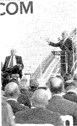
TEMER defendeu Meirelles; candidatura ainda deve ser aprovada em convenção

um "suicídio político" color suas imagens à rejeição do presidente. "Ele vai governar e colará na forma que quiser. Não tem reação pró-piê", disse o senador Jurema. "O presidente tem este modo de governo pela frente. Há muitas coisas a ser feitas e ele está totalmente dedicado a isso", afirmou Meirelles. Atualmente, nove diretórios do MDB — entre os quais Alagoas, Ceará e Paraná — são contra a candidatura do ex-ministro da Fazenda ao Planalto. Querem que o partido libere os votos para que possam fazer articulações regionais com outras legendas, como o PT, principalmente no Nordeste. Temer reconheceu o racha na legenda, mas pediu a unidade e disse esperar que Meirelles seja a única candidato no bloco de centro, possibilitando considerada remota até por seus aliados. "Pode haver divergência, que será resolvida pela convenção nacional. Mas dizer 'Ah, eu não apoio o Meirelles'. Então, que seja o partido", disse ele, sem mencionar nomes. (Agência Estado)