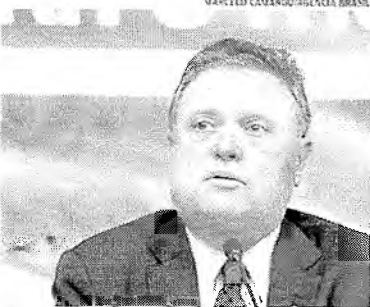
Ministro da Agricultura Blairo Maggi