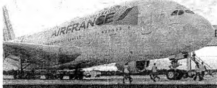
A COMPANHIA terá cinco voos semanais de Fortaleza para Paris e Amsterdã

LIA BRUNO ESPECIAL PARA O PÓVO lbruno@povo.com.br O conceito da operação do hub da Air France-KLM em Fortaleza representará um marco na maior operação de história da companhia aérea no Brasil. A partir do próximo dia 3 de maio, serão cinco voos semanais para Fortaleza. Um sexto está previsto para ser iniciado em outubro. O projeto também contará com aumento de três frequências para o Rio de Janeiro.