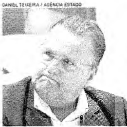
EX-MINISTRO Geddell Vieira Lima está preso na Papuda desde a estreia de 2017