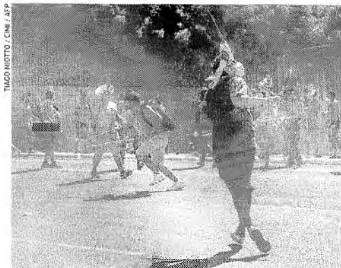
NO ÚLTIMO dia 22, indígenas e policiais entraram em confronto em Brasília

O plenário do Supremo Tribunal Federal (STF) retomou ontem o julgamento de recurso extraordinário envolvendo a tese do "marco temporal" nas discussões sobre demarcação de terras indígenas. A votação é um dos pontos centrais da disputa em curso entre lideranças indígenas e ruralistas, porque será analisada em caráter de repercussão geral, podendo o resultado servir como parâmetro para casos semelhantes no futuro.