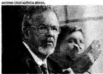
RAUL JUNGMAN, ministro da Defesa, disse que "crime já é nacional"

Segundo Jungmann, a reunião também contou, entre o ministro da Defesa, Torquato Jardim, e os secretários de Segurança do Espírito Santo, Minas Gerais e São Paulo foi fundamental para discutir como barrar o deslocamento das quadrilhas para os demais estados. Nesse encontro foi definido um protocolo de cooperação para garantir que as polícias rodoviárias desses estados possam abordar veículos em rodovias federais que conectam ao Rio de Janeiro. E afirmou que as autoridades não sabem "em que extensão a intervenção terá consequen-