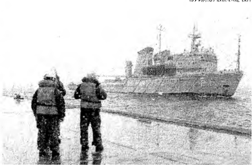
Marinha peruana busca ontem com buscas pelo submarino desaparecido

Centenas de pessoas participaram da operação, mas as condições eram "regulares" ontem, mas poderiam se complicar com o passar das horas, segundo a Armada.