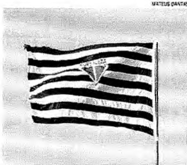
Eleição no Fortaleza, marcada para sábado, tem candidato único