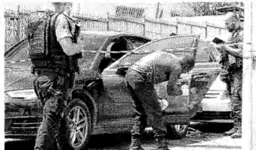
O coronel era passageiro de um carro desarmado durante o atentado. Teixeira chegou a ser levado para hospital, mas não resultou aos ferimentos

Os criminosos estavam em um carro de luxo vermelho e um outro amarelo. Um dos veículos é militar, o outro dez mil reais, um fardo de vidro e um carro de luxo de acesso do lado em que viajou