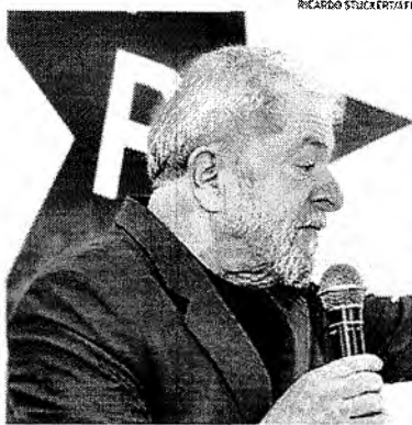
Segundo denúncia, Lula teria comandado "s sofisticada estrutura ilícita"

A força-tarefa da Operação Lava Jato denunciou ontem o ex-presidente Lula por corrupção e lavagem de dinheiro no caso do Sítio de Atibaia, interior de São Paulo. Além do ex-presidente, também foram denunciados outros 12 investigados. A denúncia refere-se à suposta propina de pelo menos R$ 128,146,513,33 pagas pela Odebrecht, em quatro contratos firmados com a Petrobras, bem como a vantagens indevidas de R$ 27.081.186,71, pagas pela OAS, em três contratos firmados com a estatal.